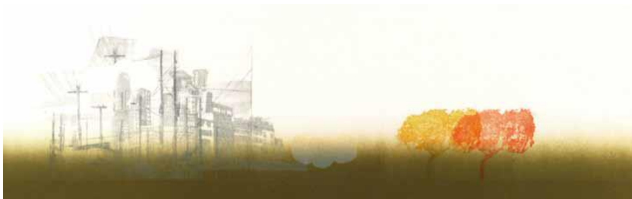
Emmanuelle Giora, Paysage urbain , N.3, 2006, eau-forte sur papier

Dans Souvenirs from , une série de neuf sérigraphies, réalisées lors d'une résidence d'artistes aux Etats-Unis dans l'Etat de New-York (2012), elle se réapproprie des cartes postales trouvées dans une brocante. L'image de ces paysages américains idéalisés est transformée et agrandie. L'artiste y inscrit du texte puisé dans les gros titres du New-York Times. Ainsi la carte postale perd de son intimité, en narrant un événement médiatique et devient soudainement 'universelle'.