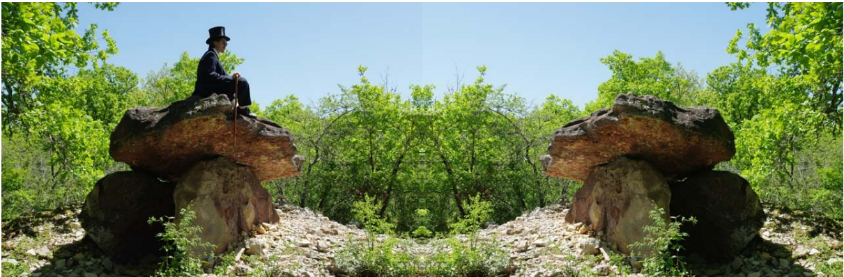
Dolmen Los Tres Peyres, Pech de Récobert, 2009