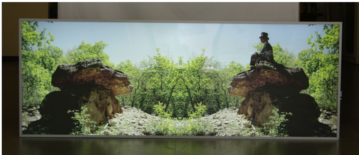
L'Oracle imaginaire , vue d'exposition | exhibition view, L'Usine, Belfort, 2011 caisson lumineux | light box

The viewer in faced the elements of his environment as omniscient in and in opposite. A time lapse opens.