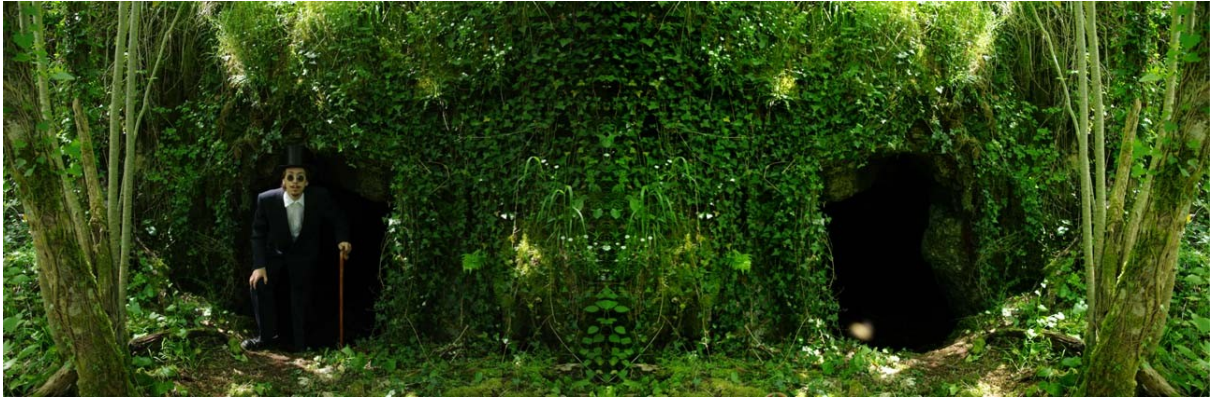
Grotte de Ladoux, Les Arques, 2009