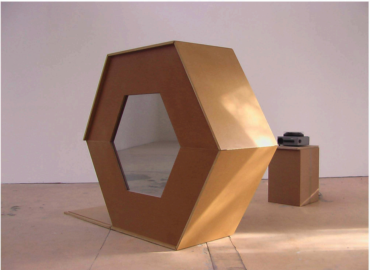
Vue d'installation, Regionale4, Fabrikculture, Hégenheim, 2003